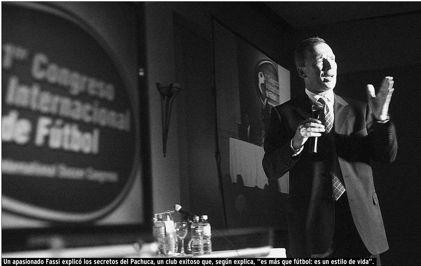
Un apasionado Fassi explicó los secretos del Pachuca, un club exitoso que, según explica, "es más que fútbol: es un estilo de vida".

En el aspecto comercial, y con un video alusivo, Fassi hizo hincapié en la campaña multimedia que lanzó el club, para